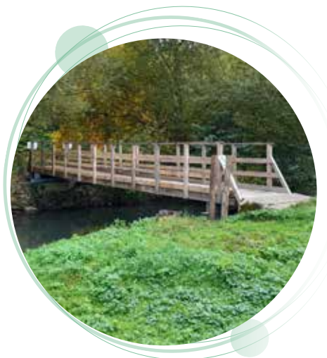
L'ancienne et la nouvelle passerelle de l'étang de Fitz-James