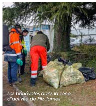
Les bénévoles dans la zone d'activité de Fitz-James

Plusieurs entreprises et structures volontaires se sont engagées dans l'opération de ramassage des déchets Clean-Up Day sur les zones d'activités de Breuil-le-Sec et Fitz-James.