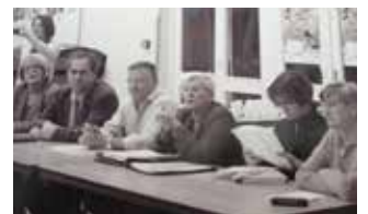
Un des premiers bureaux en 2006