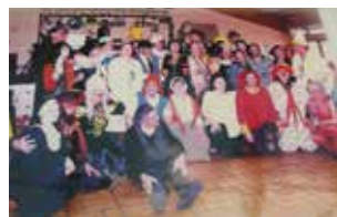
Repas carnaval en 2011