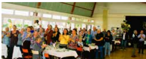
La soirée des 20 ans de l'association le 18 octobre 2025