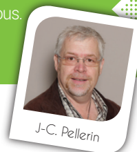
Le Maire de Fitz-James

Le site Internet quant à lui a été remanié pour plus de convivialité et de dynamisme. À l'heure de la transmission des informations et de communication via le Net, certains saisissent l'occasion de se lâcher en rédigeant des mails empreints d'agressivité, d'égoïsme, d'intolérance. C'est pourquoi, pour nous élus, il est important, de continuer à préserver les rencontres et de privilégier avant tout, avec vous, nos concitoyens, le contact visuel afin que notre commune ne perde pas son identité. Au plaisir de se rencontrer lors d'un prochain rendez-vous.