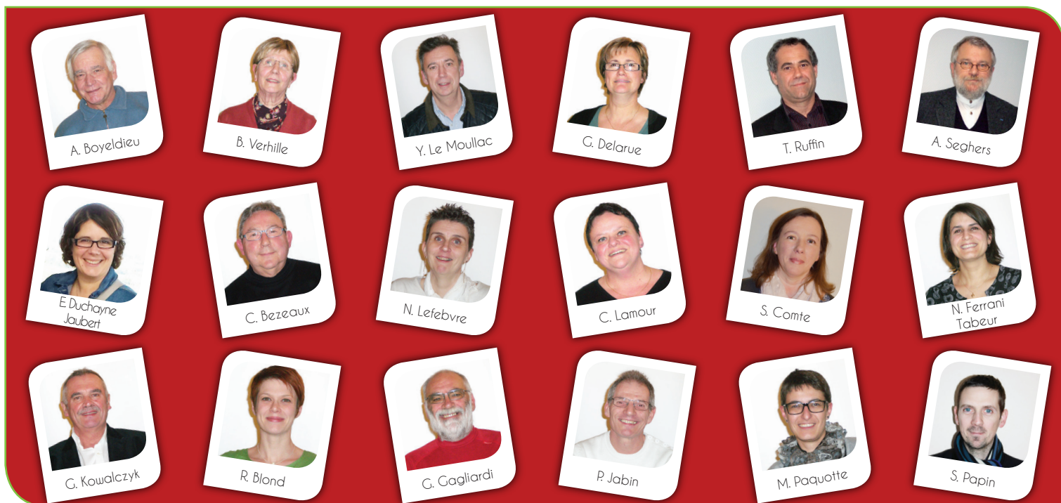
LE CONSEIL MUNICIPAL